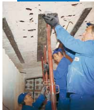
Přípevnění kovové desky pro výztuž konstrukce