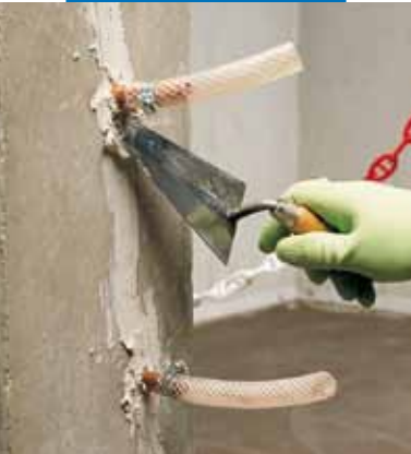
Upevňování injekčních trubic a těsnění trhlin při zpevnění konstrukce