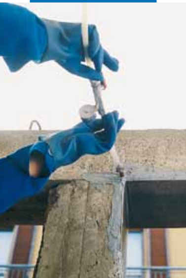
Konstrukce opravená Adesilexem PG1