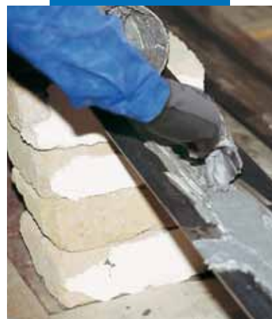
Aplikace Adesilexu PG1 na kovovou desku