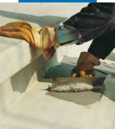
Aplikace Adesilexu PG1 zubovou stěrkou při lepení konstrukce schodů