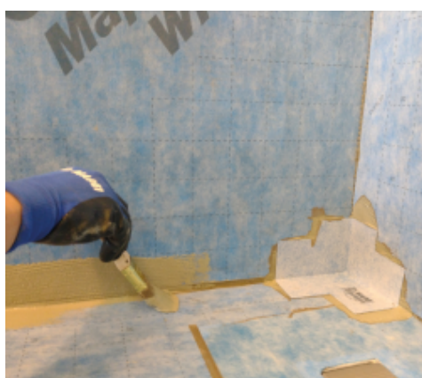
Aplikace Mapeguard WP Adhesive