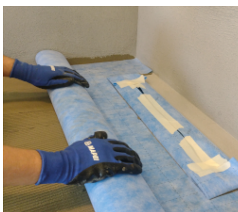
Aplikace Mapeguard WP 200

V případě instalace LVT na stěnu nebo podlahu počkejte po instalaci fólie Mapeguard WP 200 nejméně 3 hodiny, aby lepidlo Mapeguard WP Adhesive mohlo vytvrdnout. Následná instalace LVT může být provedena s použitím lepidla Ultrabond Eco MS 4 LVT nebo Ultrabond Eco MS 4 LVT Wall . Další informace týkající se použití těchto výrobků najdete v příslušných materiálových listech a systémovém řešení Shower System 4 LVT 1