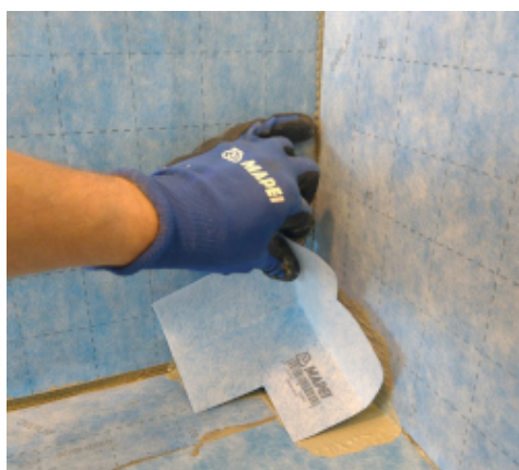
Aplikace Mapeguard IC