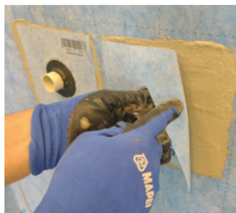
Aplikace Mapeguard PC