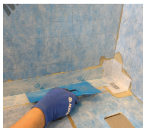
Aplikace Mapeguard ST